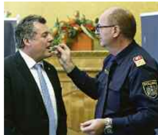
Drogentest bei Verkehrslandesrat Steinkellner, jetzt auch vermehrt bei Verkehrskontrollen.

Eine Vormerkung bleibt zwei Jahre bestehen. Wer in dieser Zeit eine weitere Vormerkung erhält, muss eine Schulungsmaßnahme absolvieren und der Beobachtungszeitraum verlängert sich auf drei Jahre. Kommt es in dieser Frist zu einer weiteren Vormerkung, mindestens drei Monate Führerscheinentzug.