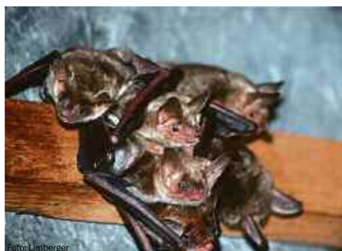
Eine Fledermaus-Wochenstube besteht aus 10 bis 20 Tieren. Ihre bevorzugten Quartiere werden aber weniger.