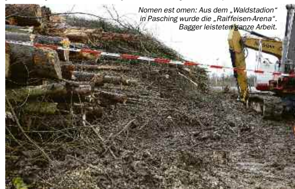
Nomen est omen: Aus dem „Waldstadion“ in Pasching wurde die „Raiffeisen-Arena“. Bagger leisteten ganze Arbeit.

auch überprüfbar sein.“ Mit der Petition 1305/2019 an das Europäische Parlament bringt die Plattform Waldschutz-Pasching Beschwerde gegen die mangelnde Umsetzung des Aarhus-Abkommens in Österreich ein. Um ein Umdenken der Entscheidungsträger zu bewirken, erbitten Kropshofer & Co. möglichst viele Unterstützungserklärungen. Unterstützer registrieren sich unter https://tinyurl.com/ybdmv7cx.