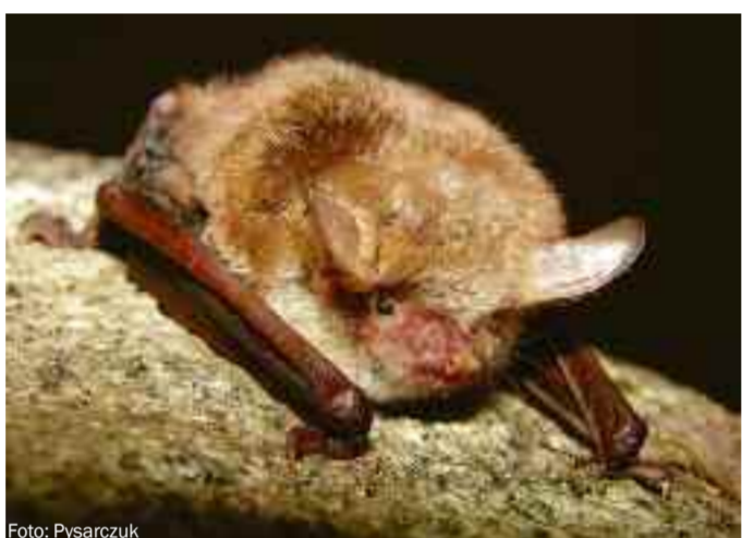
Die Mausohrfledermaus ist in Oberösterreich schon eine Rarität, das gilt auch für die Wimpernfledermaus.

Fangnetzen aus. Spannende Einblicke in das Leben der Fledermäuse bietet die „Bat-Night“ als Naturschauspielveranstaltung unter der Führung von Julia Kropfberger am 27. Juli (20 bis 22.30 Uhr) in St. Marienkirchen an der Pölz im Naturpark Obst-Hügel-Land. Zehn Plätze sind noch frei, der Termin am 30. Juli ist bereits ausgebucht. Für Gruppen gibt es individuelle Termine. Infos: www.naturschauspiel.at oder 07249/47112-25.